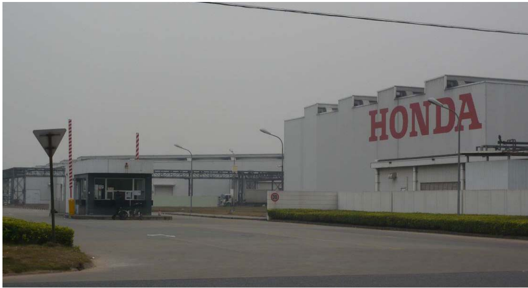
圖一：南海本田零部件西面大門

南海本田於 2007 年 3 月 8 日在廣東省佛山市南海科技工業園區投產，是本田技研工業株式會社在中國設立的首家獨資公司，總投資額 9800 萬美元。主營生產銷售汽車變速箱及汽車發動機關鍵零部件，年生產能力為 24 萬套，直接為廣汽本田、東風本田等系統內公司供貨。據報導，2010 年南海本田每日生產變速箱 2400 台，以一萬元內部價格賣出，一天產值 2400 萬元，加上其他業務，一天產值達到 4000 萬元 1 。