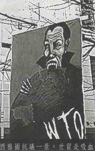
西雅圖抗議一景：世貿是吸血