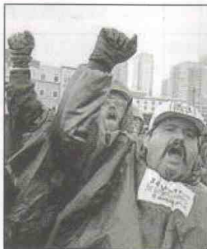
參與西雅圖抗議的工人：保護主義還是國際主義？

反對將社會條款加進世貿的國家亦經常扭曲勞工權利去合理化侵犯工人的惡行。像中國、馬來西亞和其他發展中國家的專制政府，指核心的國際勞工公約並不適用於它們國家，甚至乾脆指公約所保障的勞工權利乃「西方價值」。這顯示了勞工權利怎樣又一次被扭曲去符合這些政府的利益。我們要清楚指出，國際勞工組織的核心勞工權利，是很基本很基本的勞工和工會權利，它們具有普遍意義，所有地方的工人都應該擁有。在「已發展」和「發展中」國家之間，工人的基本權利是沒有分別的。